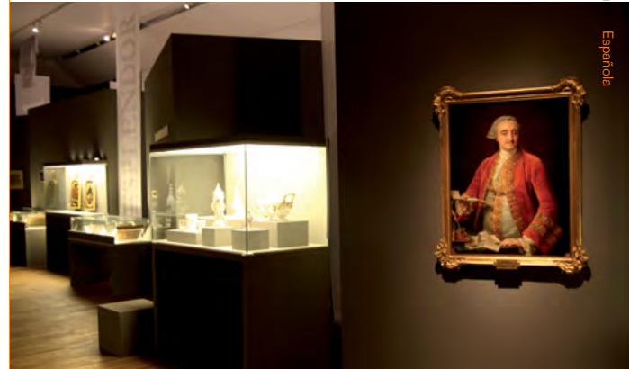
2 La lengua y la palabra: trescientos años de la Real Academia Española. III Centenario de la Fundación de la RAE

Asimismo, en el exterior estas actividades conmemorativas suponen también una oportunidad para reforzar las relaciones internacionales de España con un país o región determinada, ya que a AC/E le compete garantizar, en cumplimiento de las directrices estratégicas culturales, la presencia en aquellas conmemoraciones culturales e histórico-artísticas relevantes para la proyección exterior de la Marca España.