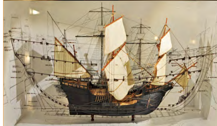
3 Pacífico. España y la aventura de la Mar del Sur. V Centenario del Descubrimiento del Océano Pacífico