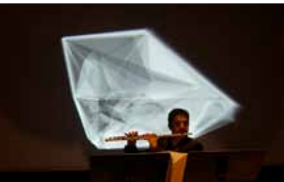
Pronomos in New York. Mobility: Julián Elvira. Segal Theater. University of New York, Jun 2015

This programme is designed to strengthen the contribution of the European culture sectors to the EU strategy of job creation and sustainable and inclusive growth called 'Europe 2020'.