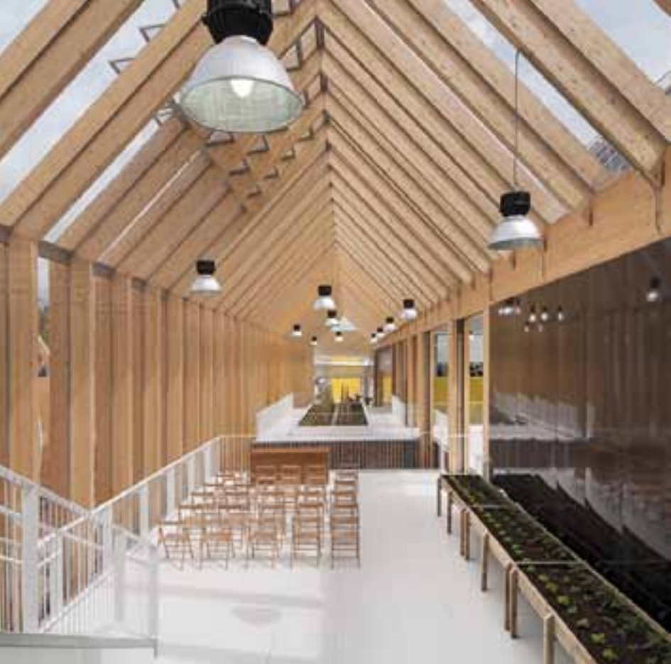
Spain Pavilion at Expo Milano 2015, May - Oct 2015