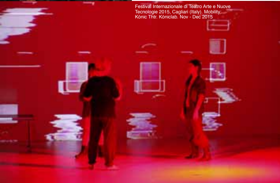
Festival Internazionale di Teatro Arte e Nuove Tecnologie 2015, Cagliari (Italy). Mobility: Kónic Thtr. Kóniclab. Nov - Dec 2015