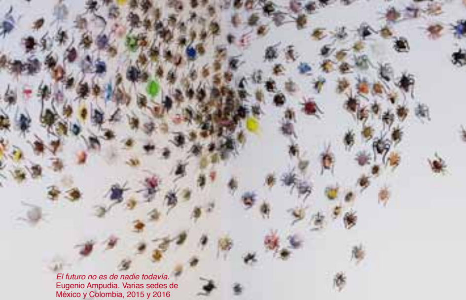
El futuro no es de nadie todavía. Eugenio Ampudia. Varias sedes de México y Colombia, 2015 y 2016