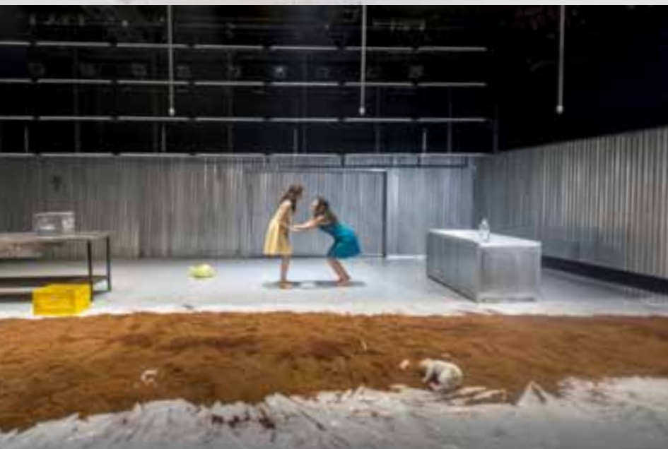
Yerma en el GALA Hispanic Theater. Washington (EE.UU.). Programa Movilidad, Sep - Oct 2015