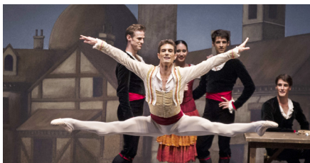
Compañía Nacional de Danza, FIC 2016. Festival Internacional Cervantino (Guanajuato), 05 - 23 Oct 2016