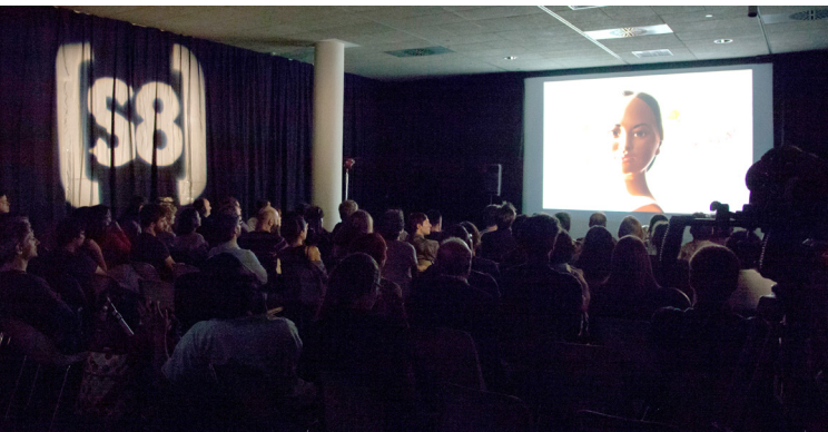
(S8) Mostra Internacional de Cinema Periférico 2017 (La Coruña), 31 May – 04 Jun 2017