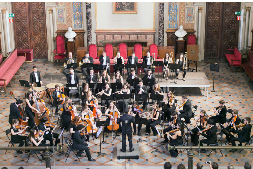
Directores internacionales en la Joven Orquesta Sinfónica de Barcelona JOSB. Paraninfo – Universitat de Barcelona, 20 – 23 May 2016