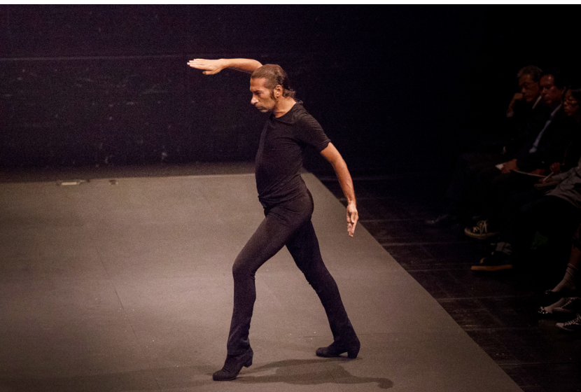
Israel Galván, Aichi Triennale 2016 Rainbow Caravan (Japón), Ago – Oct 2016