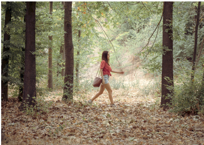
Sister of Mine (Pedro Aguilera). Edinburgh International Film Festival, 21 Jun - 02 Jul 2017