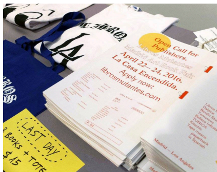
LA Art Book Fair 2016 (Los Angeles). The Geffen Contemporary at MOCA, 12 – 14 Feb 2016