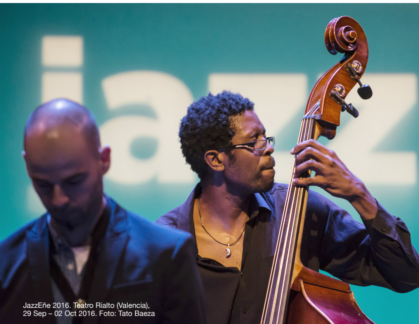
JazzEñe 2016. Teatro Rialto (Valencia), 29 Sep – 02 Oct 2016.