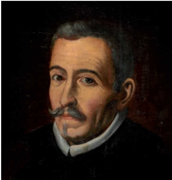
Anónimo Retrato de Lope de Vega (detalle) Siglo XVII BNEM CE0132

La exposición Lope y el teatro del Siglo de Oro propone al visitante un recorrido por el panorama teatral de la época, en el que el arte nuevo de hacer comedias se convirtió en un fenómeno de gran popularidad y pujanza. A través de las piezas expuestas y de las aplicaciones informáticas y audiovisuales proporcionadas por bibliotecas, museos, compañías de teatro y equipos de investigación, se pone de manifiesto cómo se ha constituido a lo largo de los siglos en un bien cultural de primer orden.