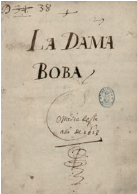
Lope de Vega La dama boba Portada del manuscrito autógrafo BNE VITR/7/5

“Necesidad y yo, partiendo a medias el estado de versos mercantiles, pusimos en estilo las comedias. Yo las saqué de sus principios viles, engendrando en España más poetas que hay en los aires átomos sutiles.”