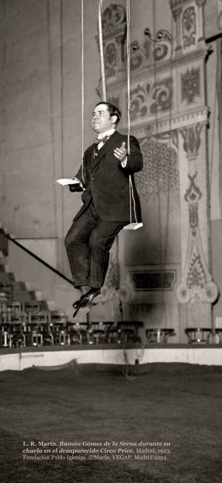
Ramón Gómez de la Serna durante su charla en el desaparecido Circo Price. Madrid, 1923.