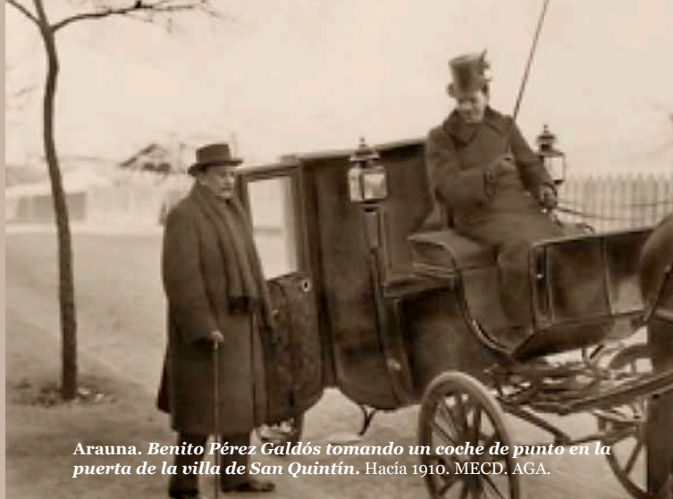
Arauna. Benito Pérez Galdós tomando un coche de punto en la puerta de la villa de San Quintín. Hacia 1910. MECD. AGA.

y publicaciones ilustradas, desde los días del Romanticismo y la apoteosis del retrato fotográfico producido durante el reinado de Isabel II, hasta el inicio de la larga noche de piedra del franquismo, pasando por la época de la Restauración y la Regencia, la Dictadura de Primo de Rivera, la Dictablanda de Berenguer, la trémula esperanza republicana y los años infortunados de la Guerra Civil.