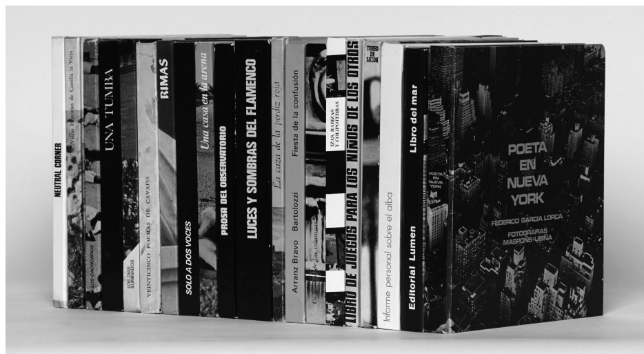
Palabra e Imagen. Barcelona: Lumen, 1961-1975. Colección del Museo Nacional Centro de Arte Reina Sofía (Biblioteca y Centro de Documentación)