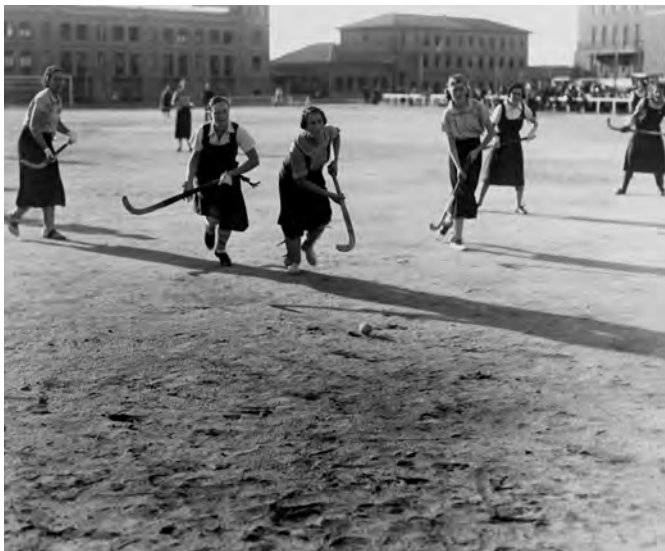
● Partido de hockey entre el equipo de la Residencia de Señoritas y el del Club de Campo, con los edificios de la Residencia de Estudiantes al fondo, 1933. Residencia de Estudiantes, Madrid.