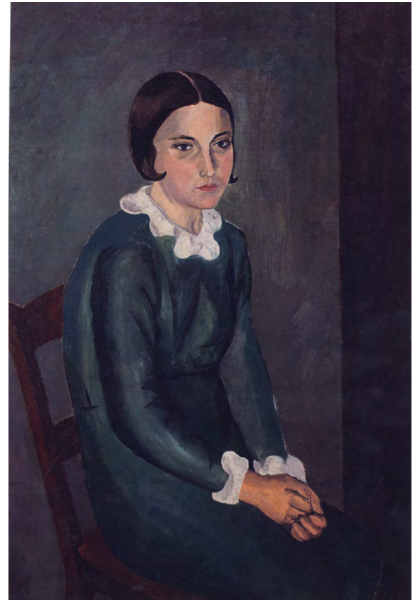
● Menchu Gal, Retrato , hacia 1933. La pintora Menchu Gal fue residente entre 1933 y 1936. Galería Lorenart. © Menchu Gal, VEGAP, Madrid, 2016.

El colectivo de las residentes, compuesto, además de por las que alcanzaron mayor notoriedad, por mujeres de todos los rincones de España, constituyó la vanguardia de un modelo de mujer profesional e independiente que todavía resultaba exótico en la sociedad de su época. ●