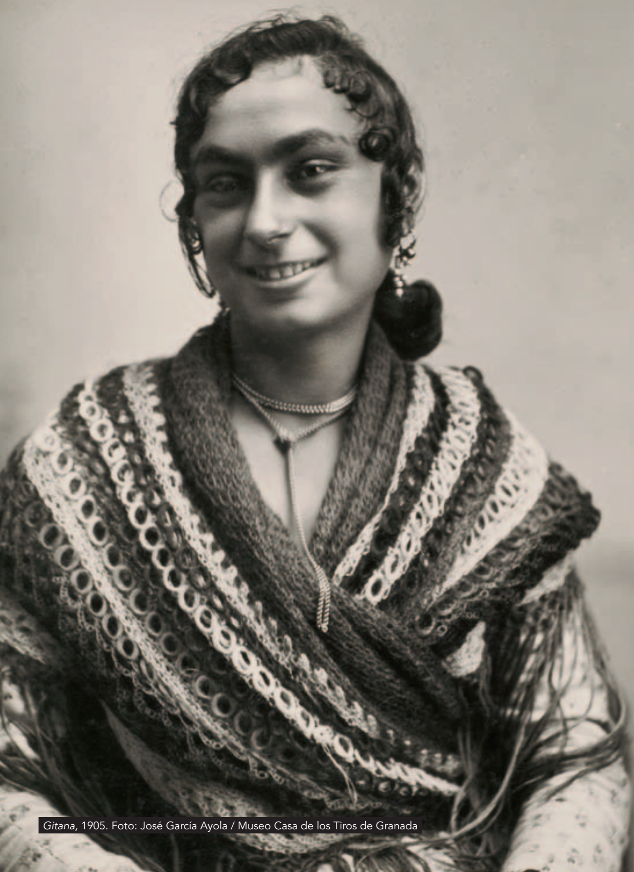
Gitana, 1905.