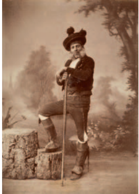
Retrato de Chorrojumo.

gitanos. Son pobres, son marginados y son gitanos y gitanas. Evidentemente, las consecuencias de que una parte de la sociedad viva en la pobreza y en la marginación las sufre la sociedad en su conjunto. Pero la pobreza y la marginación no son problemas de los pobres y los marginados, son enfermedades sociales que han de tratar las instituciones gubernamentales, que para eso están. Pues ni siquiera en este caso hay quien sepa cuántos pobres y marginados son gitanos.