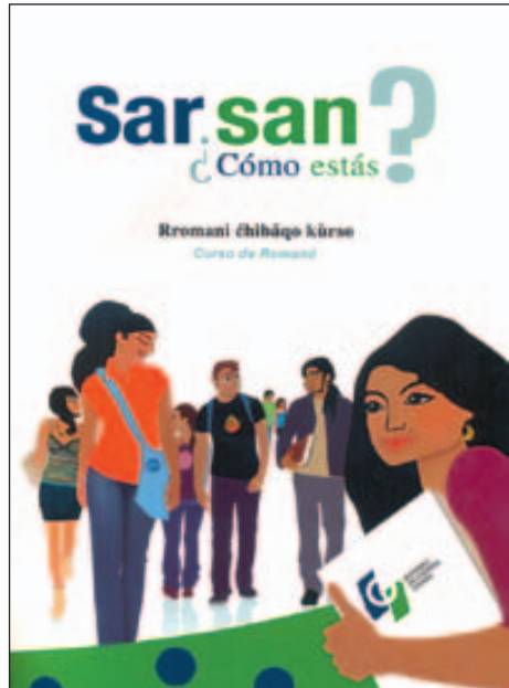
Portada del libro Sar san. ¿Cómo estás? , curso de romanó editado por el Instituto de Cultura Gitana